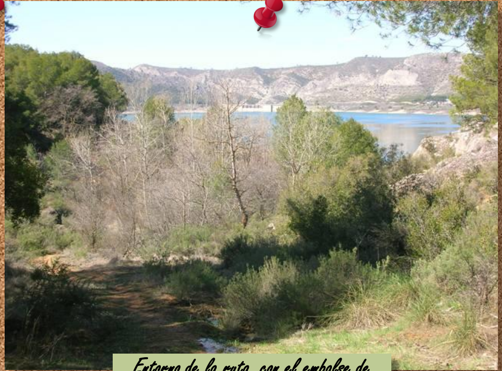
Entorno de la ruta, con el embalse de Buendía al fondo

Las Caras de Buendía por definición, es un paraje formado por pinares y rocas areniscas del Embalse de Buendía en el que se encuentran esculpidas unas 18 esculturas de 1 a 8 metros de altura por varios autores, teniendo este un recorrido turístico acondicionado para su visita. Estas esculturas rompen la frontera de los museos y ensalzan y engrandecen la relación escultura y naturaleza, estando totalmente integradas en la roca arenisca, al estilo del Egipto Faraónico.